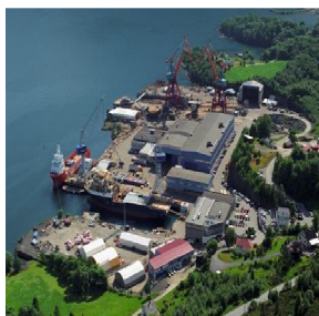
Kleven Verft arbeider med RFID løsning for styring og kontroll med verktøy utlån og inngående varestrøm