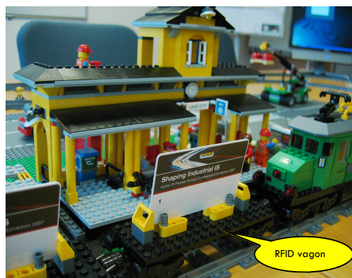
(Løsningen er laget av vår partner Onkel Estrup As)

Når deltageren har besøkt 5 utstillere, kan dette registreres via legotoget som står ved inngangen. En SMS bekrefter da deltagelse i konkurransen. Det er 11 utstillere.